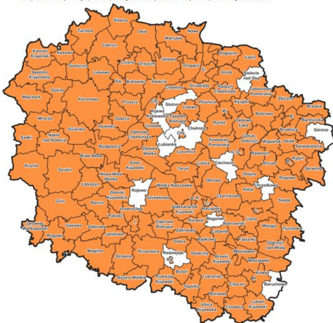
Mapa 3. Realizacja usług opiekuńczych w gminach województwa kujawsko-pomorskiego w 2023 roku